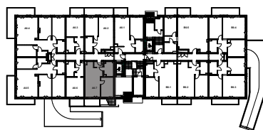
↑ RZUT KONDYGNACJI