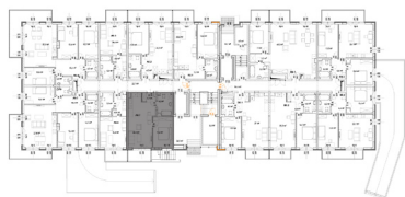
↑ RZUT KONDYGNACJI