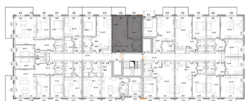
↑ RZUT KONDYGNACJI