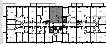
↑ RZUT KONDYGNACJI