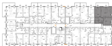
↑ RZUT KONDYGNACJI